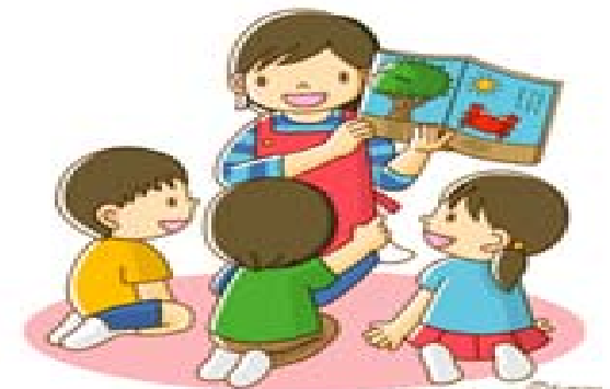
ถามผู้รู้