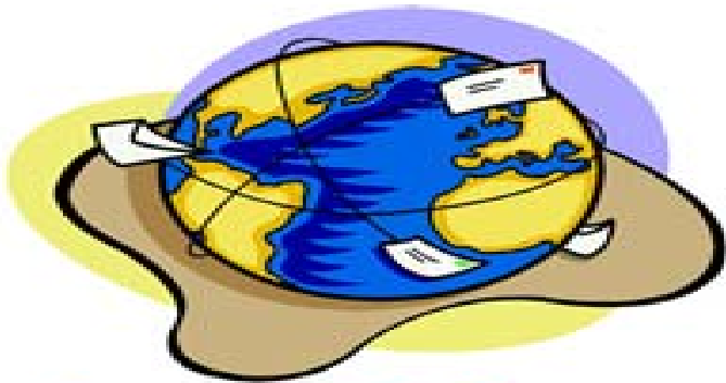
อินเทอร์เน็ต