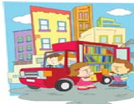
ห้องสมุด